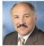
GVB BEZIRKSVERBAND OBERPFALZ UNTER BEWÄHRTER FÜHRUNG