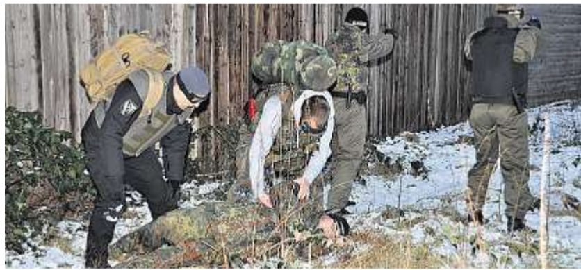
Es geht recht realistisch zu bei der Ausbildung in Waldmünchen.